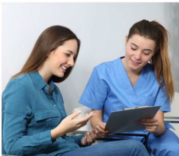
Un questionnaire médical préalable à la pose d'implants sera à remplir par vos soins afin de connaître votre état de santé général.